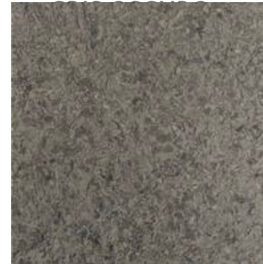
GRIS OSCURO DTL 9109