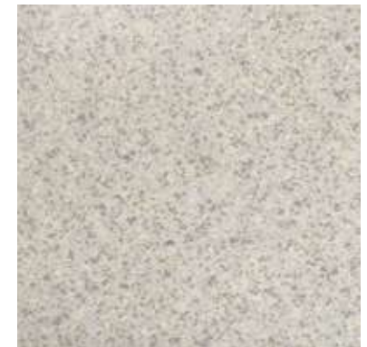
BLANCO SIN ESCARCHA P- DTL 8831-2