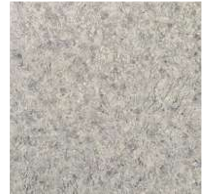
GRIS CLARO DTL 9101