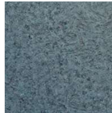
AZUL DTL 9105